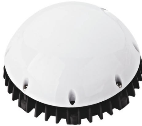
ABL120C, 24 VDC